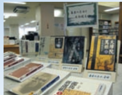
坂本龍馬や新撰組などが活躍した激動の時代

そこで、10月~11月は、『幕末の志士と篤姫』と題して激動の時代を生きた志士たちの人物像を描いている作品を中心に集めてみました。展示コーナーは図書館入退館ゲートを通過すると目の前にあります。