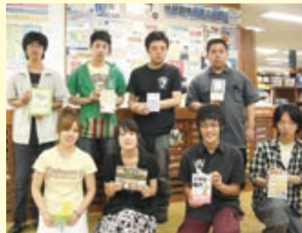
今回、参加した学生の皆さん