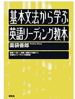
基本文法から学ぶ英語リーディング教本