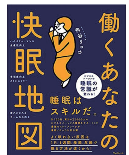
働くあなたの快眠地図