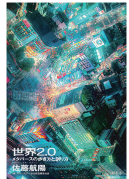
世界2.0 メタバースの歩き方と創り方